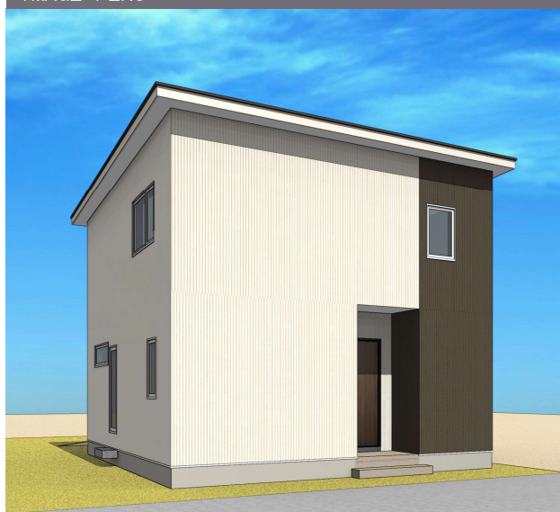
※パースはイメージです。